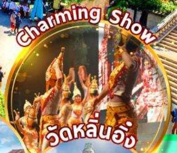
วัดหลินอิ่ง