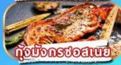
กุ้งมังกรชอสเนย