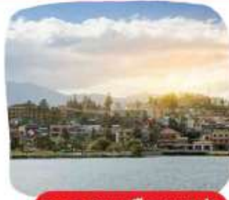
ทะเลสาบเมืองซาปา