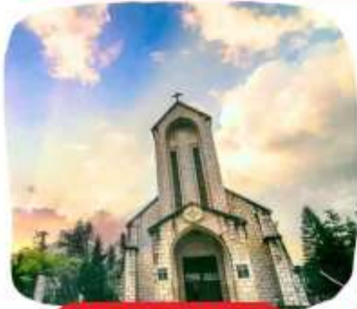
โบสถ์หินซาปา

แนะนำสถานที่ท่องเที่ยวในเมืองซาปา (ราคาทัวร์ไม่รวมค่าเดินทาง)