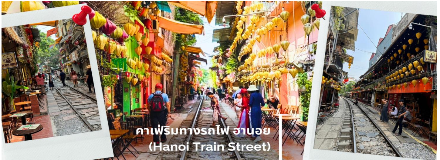
คาเฟ่ริมทางรถไฟ ฮานอย (Hanoi Train Street)