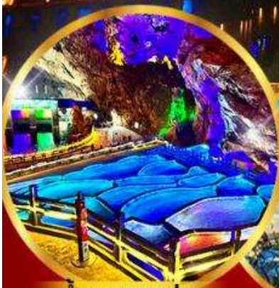
ถ้ำนงกวางแอน