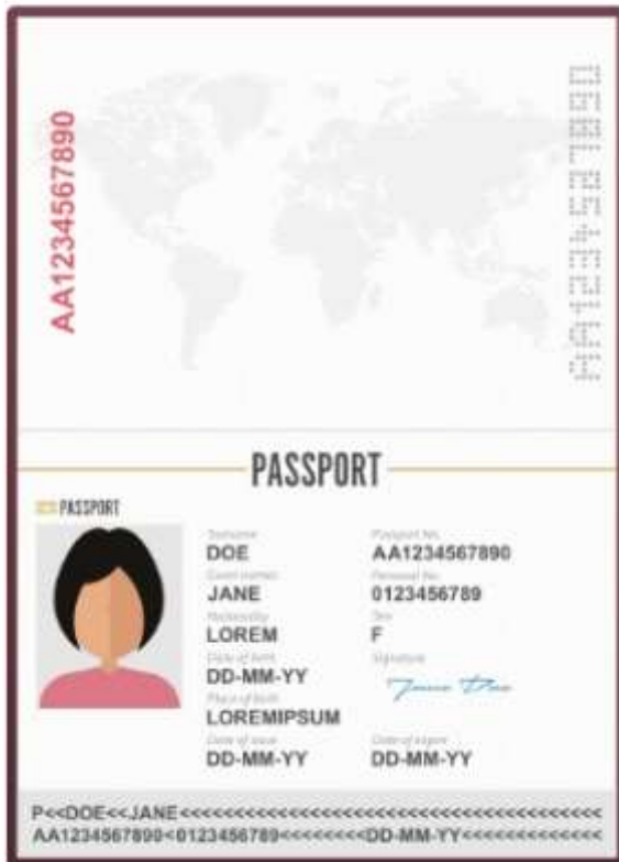
รูปถ่ายหน้าพาสปอร์ต