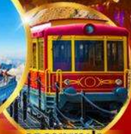
รถรางซาปา