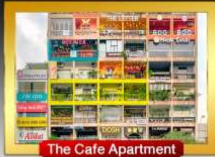
The Cafe Apartment