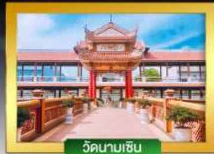
วัดนามเซิน