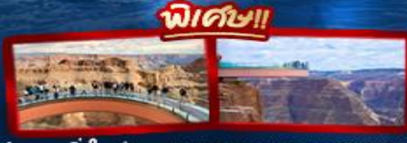
ชมความยิ่งใหญ่ของ GRAND CANYON WEST SKYWALK

อเมริกาตะวันตก ลอสแอนเจลิส ลาสเวกัส ซานฟรานซิสโก