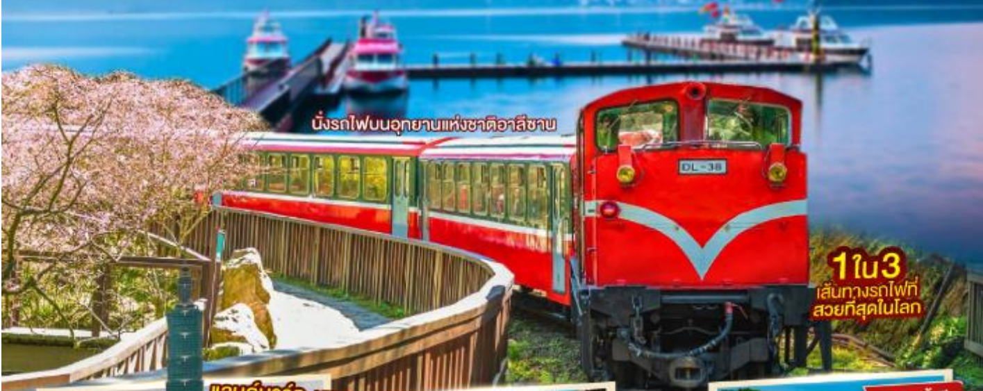
นั่งรถไฟบนอุทยานแห่งชาติอาลีซาน

Sabai Trip ประกันอุบัติเหตุและอุบัติเหตุ คุ้มครองสูงสุด 3,000,000 ฟรีประกันภัยการเดินทาง