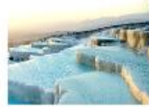
เมืองปามุคคาเล่

** พักที่ Richmond Thermal Hotel 5* หรือเทียบเท่า **