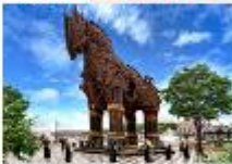
เมืองขานัคคาเล่

** พักที่ Buyuk Truva Hotel 4* หรือเทียบเท่า **