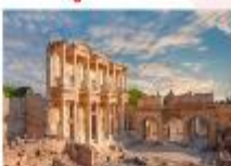
เมืองเอเฟซุส

** พักที่ Le Blue Hotel 5* หรือเทียบเท่า **