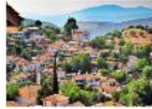
หมู่บ้านออดโตมัน