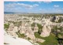
หุบเขาเดเฟเรนท์

** พักที่ Dedeli Cave Hotel 5* หรือเทียบเท่า **