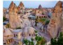
เมืองคัปปาโดเกีย

** พักที่ Under Cave Hotel 5* หรือเทียบเท่า **