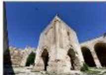
คาราวานสโรน