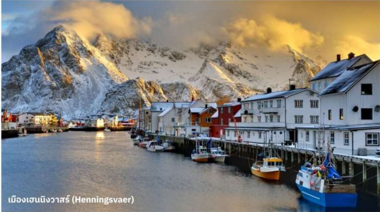
เมืองเฮนนิ่งวาร์ (Henningsvaer)

จากนั้นนำท่านเดินทางสู่ เมืองเฮนนิ่งวาร์ (Henningsvaer) เป็นเมืองท่าและหมู่บ้านชาวประมงเป็นที่รู้จักในเรื่องของสถาปัตยกรรมบ้านไม้สีสดใสที่ตั้งอยู่ริมทะเล อีกทั้งยังมีประวัติศาสตร์เกี่ยวกับการประมงที่ยาวนาน ในฤดูหนาว นักท่องเที่ยวสามารถชมปรากฏการณ์แสงเหนือ (Northern Lights) และในฤดูร้อนสามารถเพลิดเพลินกับกลางวันที่ยาวนานของแสงแดด (Midnight Sun)