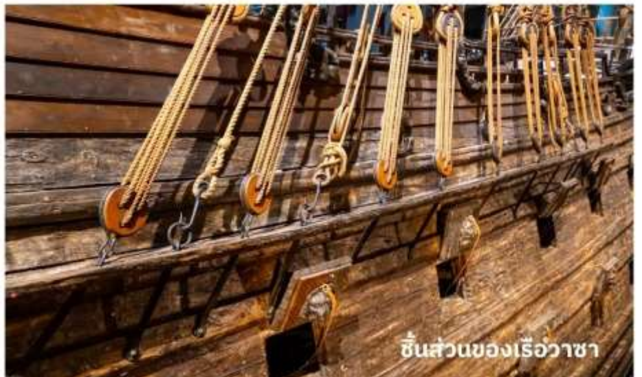
ชิ้นส่วนของเรือวาซา