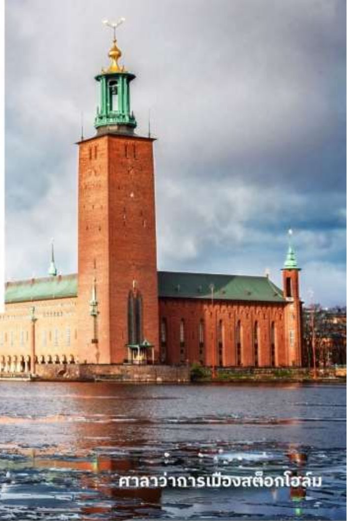
ศาลาว่าการเมืองสต็อกโฮล์ม

จากนั้นนำท่านเข้าชมด้านใน ศาลาว่าการเมืองสต็อกโฮล์ม เป็นหนึ่งในสถานที่สำคัญทางสถาปัตยกรรมและ ประวัติศาสตร์ของเมืองสต็อกโฮล์ม และเป็นสถานที่จัด งานเลี้ยงอาหารค่ำในพิธีมอบรางวัลโนเบลทุกปีตัว อาคารถูกสร้างขึ้นระหว่างปี ค.ศ. 1911 ถึง ค.ศ. 1923 อาคารนี้มีความโดดเด่นด้วยหอคอยที่สูงถึง 106 เมตร มีรูปปั้นทองคำสามมงกุฎอยู่ด้านบน ซึ่งเป็นสัญลักษณ์ ของสวีเดน