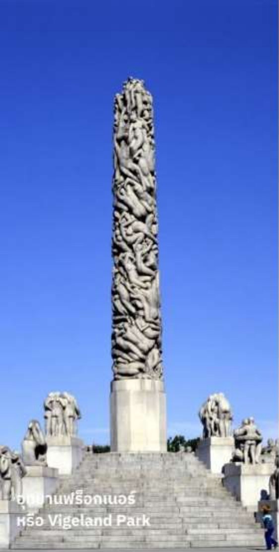
อุทยานฟรีกเนอร์ หรือ Vigeland Park