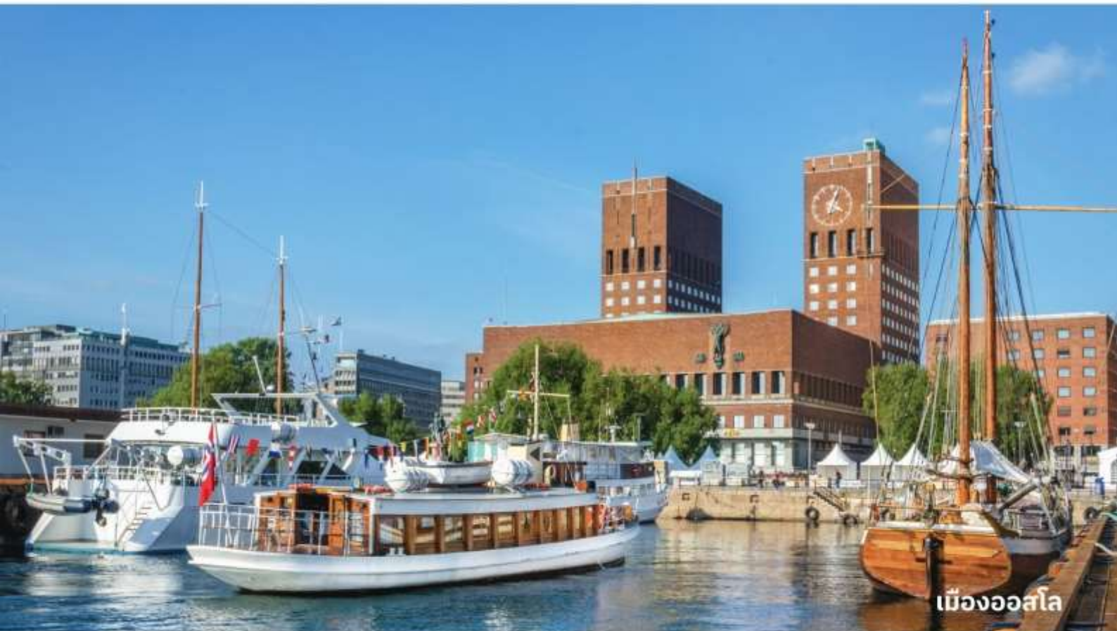
เมืองออสโล

เป็นเมืองที่มีค่าครองชีพสูงที่สุดในโลกแทนที่โตเกียว ออสโลตั้งอยู่ขอบด้านเหนือของอ่าวฟยอร์ด