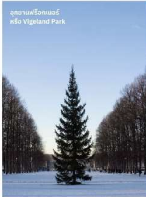
อุทยานฟรีกเนอร์ หรือ Vigeland Park

เป็นสวนสาธารณะที่มีชื่อเสียงในเมืองออสโล เป็นสวนที่จัดแสดงงานประติมากรรมของศิลปินชื่อดังชาวนอร์เวย์ชื่อ Gustav Vigeland ซึ่งประกอบไปด้วยงานประติมากรรมมากกว่า 200 ชิ้น ซึ่งเน้นที่ศิลปะที่เป็นธรรมชาติและมนุษย์ทำให้ Frogner Park เป็นสถานที่ท่องเที่ยวที่น่าสนใจอย่างมากในออสโล