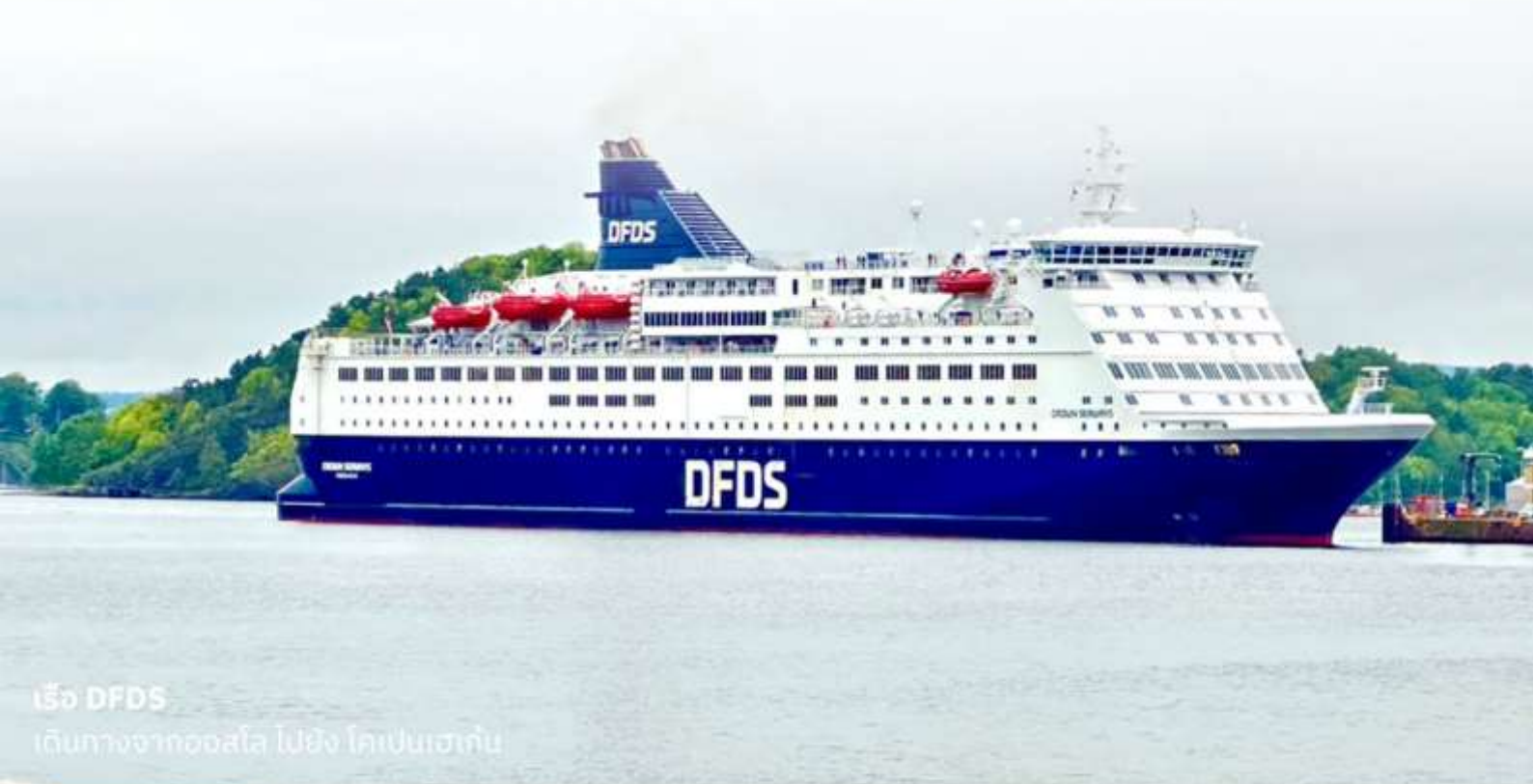
เรือ DFDS เดินทางจากออสโล ไปยัง โคเปนเฮเกน