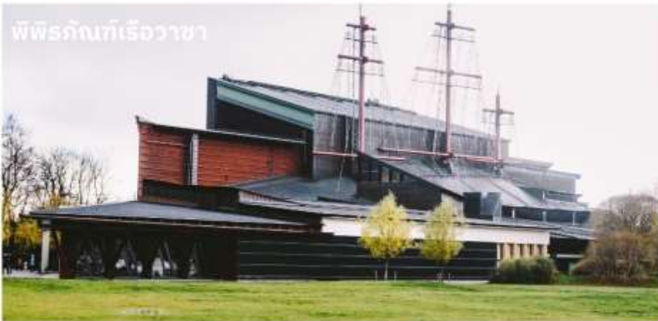
พิพิธภัณฑ์เรือวาซา