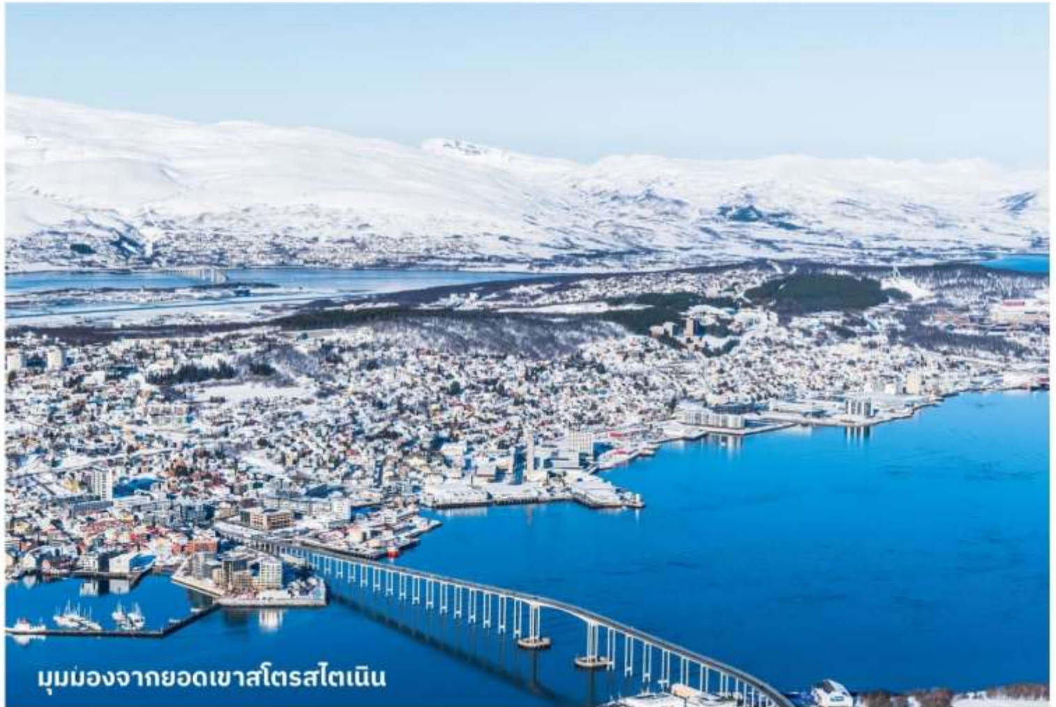
มุมมองจากยอดเขาสโตรสไตเนน

จากนั้นนำท่าน สู่ยอดเขาสโตรสไตเนน (STORSTEINEN MOUNTAIN) โดยกระเช้าไฟฟ้า เขาแห่งนี้เป็นหนึ่งในยอดเขาที่มีจุดชมวิวที่สวยงาม และเป็นที่ยอดนิยมในหมู่นักเดินทางและนักปีนเขา มีเส้นทางเดินป่าที่ท้าทายและทิวทัศน์ที่งดงาม เหมาะสำหรับผู้ที่ชื่นชอบธรรมชาติและกิจกรรมกลางแจ้ง อิสระให้ท่านได้เดินเล่นและถ่ายรูปตามอัธยาศัย