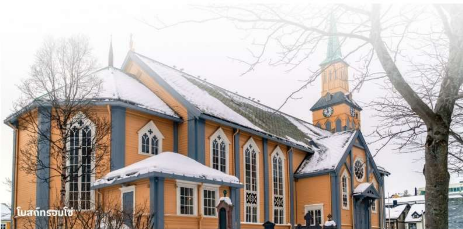
โบสถ์ทรอมโซ่

เป็นโบสถ์ที่ตั้งอยู่ใจกลางเมืองทรอมโซ่ มีสถาปัตยกรรมสวยงาม และเป็นโบสถ์ไม้ที่ใหญ่ที่สุดในนอร์เวย์ สถานที่นี้ไม่เพียงแต่เป็นที่สักการะ แต่ยังเป็นจุดท่องเที่ยวที่มีความสำคัญทางวัฒนธรรมอีกด้วย