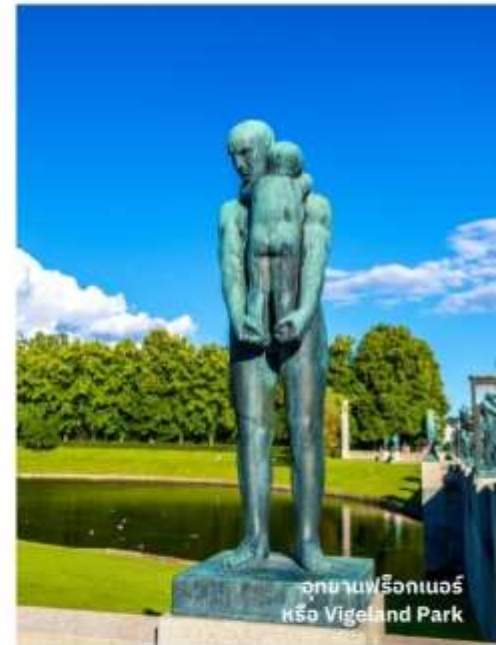
อุทยานฟรีกเนอร์ หรือ Vigeland Park

จากนั้นนำท่านถ่ายรูปด้านนอก ปราสาท Akershus งานสถาปัตยกรรมอันเก่าแก่ในยุคเรอเนสซองส์ และนำท่านเที่ยวชม กรุงออสโล นครเก่าแก่อายุกว่า 1,000 ปี เป็นเมืองหลวงมาตั้งแต่สมัยไวกิงเรื่องอำนาจ ผ่านชมกำเนิดรัฐบาล พระบรมมหาราชวังที่ประทับของพระมหากษัตริย์แห่งนอร์เวย์