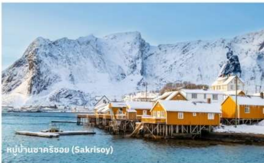
หมู่บ้านซาคริชอย (Sakrisoy)

อีกหนึ่งหมู่บ้านเล็กๆ ในหมู่เกาะ Lofoten ของนอร์เวย์ เป็นที่รู้จักจากทิวทัศน์ที่สวยงาม โดยมีบ้านสีเหลืองสดใสที่ตั้งอยู่ริมทะเลและภูเขาที่สูงตระหง่านอยู่เบื้องหลัง เป็นจุดที่ดีสำหรับการถ่ายภาพและการพักผ่อน