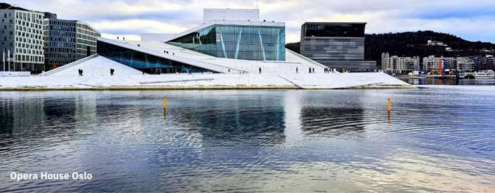
Opera House Oslo

จากนั้นนำท่านถ่ายรูป The Oslo Opera House หนึ่งในโครงการปรับปรุงบริเวณชายฝั่งของออสโล ให้เกิดเป็นพื้นที่ที่มีประโยชน์ ด้วยเงินทุนมหาศาล และการปรับผังการจราจรของชายฝั่งด้านตัวเมือง ออสโล ภายในอาคารมีการจัดแสดงการแสดงโอเปร่าและบัลเลต์ รวมถึงการแสดงศิลปะอื่น ๆ อีกมากมาย มีห้องแสดงหลักที่สามารถรองรับผู้ชมได้มากกว่า 1,300 คน Oslo Opera House เป็นหนึ่งในสถาปัตยกรรมที่โดดเด่นและเป็นที่รู้จักมากที่สุดของประเทศ และได้รับรางวัลหลายรางวัลสำหรับการออกแบบที่สร้างสรรค์และนวัตกรรม