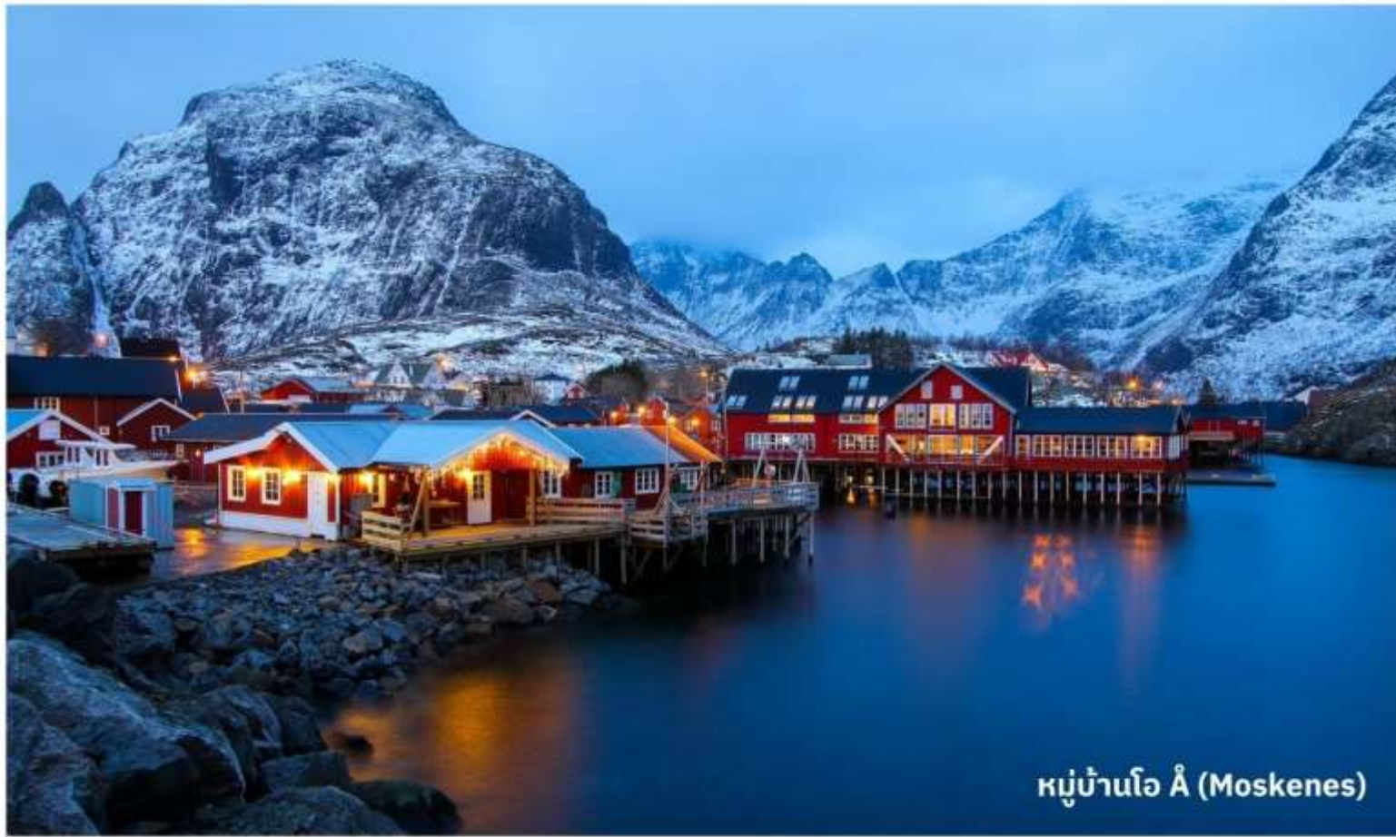
หมู่บ้านโอ Å (Moskenes)

จากนั้นนำท่านสู่ หมู่บ้านไรเนอ (Reine) ใช้เวลาเดินทางประมาณ 15 นาที