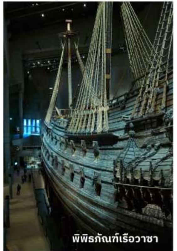
พิพิธภัณฑ์เรือวาซา

เรือลำนี้ได้ถูกยกขึ้นมาจากใต้ทะเลโดยใช้เทคนิคพิเศษที่มีความทันสมัย และได้นำเรือวาซาลำดังกล่าวมาจัดแสดงเป็นพิพิธภัณฑ์ ทุกท่านจะได้พบกับเรือ Vasa ขนาดใหญ่ และจะได้ชมโครงสร้างของเรือ, ประวัติของการสร้างและสถานการณ์ที่ทำให้เรือล่มรวมถึงเรียนรู้เรื่องราวต่างๆ ที่เกี่ยวข้องกับ Vasa ได้อย่างลึกซึ้ง