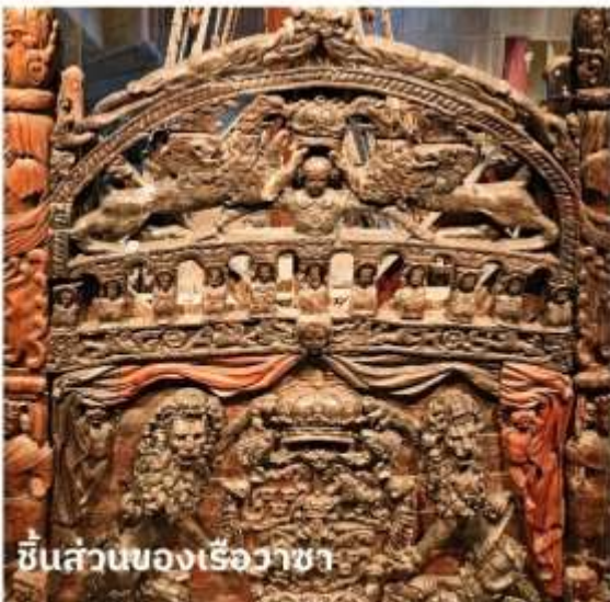
ชิ้นส่วนของเรือวาซา