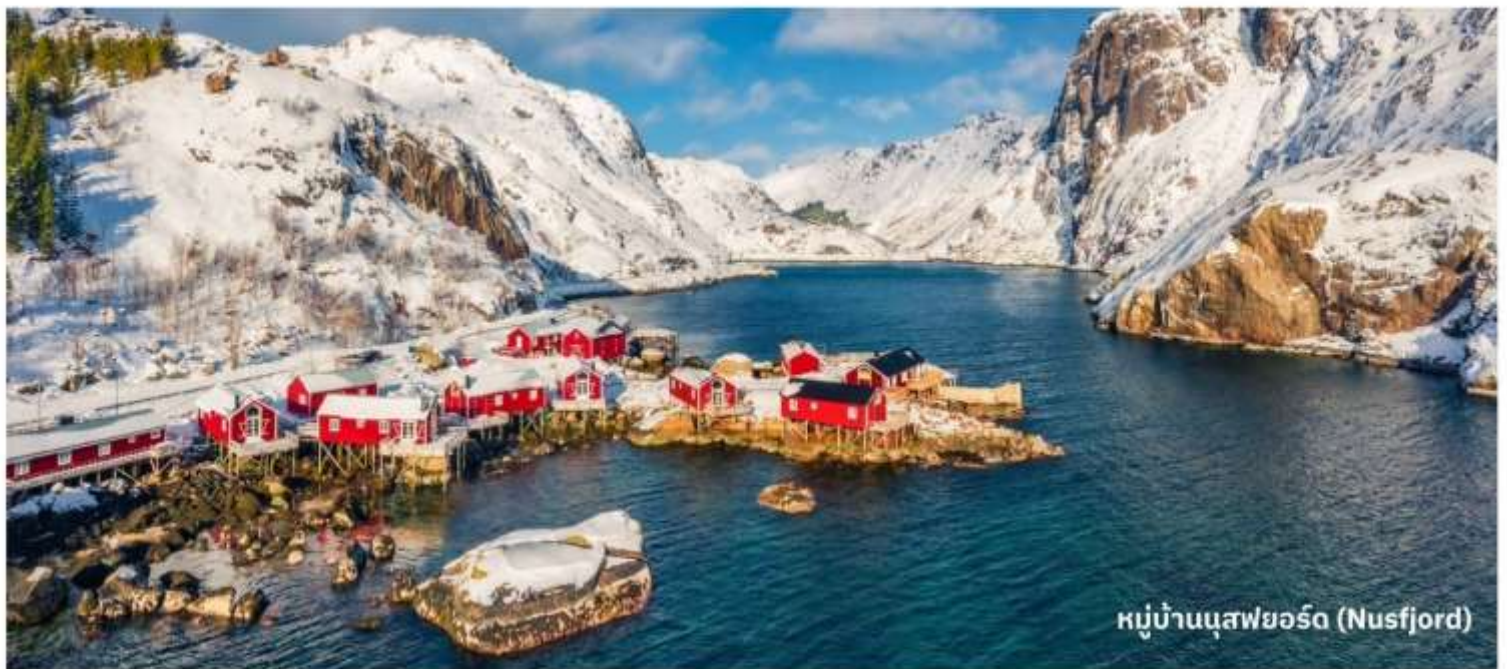
หมู่บ้านนุสฟยอร์ด (Nusfjord)

เป็นหมู่บ้านประมงเก่าแก่ที่มีประวัติศาสตร์ยาวนานและได้รับการอนุรักษ์เป็นอย่างดี Nusfjord เป็นหนึ่งในหมู่บ้านที่เก่าแก่ที่สุดใน Lofoten และถือเป็นมรดกทางวัฒนธรรมที่สำคัญ ที่นี่ยังมีบ้านไม้แบบดั้งเดิม ร้านค้า และโรงงานแปรรูปปลา ซึ่งทำให้ผู้เยี่ยมชมสามารถสัมผัสกับชีวิตในอดีตของชาวประมงได้ อิสระให้ท่านได้เดินชมบรรยากาศที่สวยงามของหมู่บ้าน และ ถ่ายรูปตามอัธยาศัย