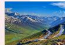
หุบเขา Naran Kaghan

** พักที่ Besham Hilton Hotel หรือเทียบเท่า **