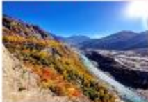
บ้อมปราการ Altit Fort

DAY4 บ้อมปราการอัลติท-ตลาดพื้นเมือง-ฮอปเปอร์ กลาเซียร์- หุบเขาคุยเกอร์