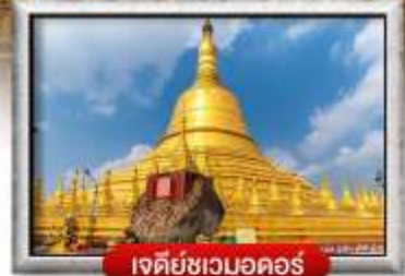
เจดีย์ชเวมอดอร์

เมนู สุดพิเศษ | กุ้งแม่น้ำเผา + บุฟเฟ่ต์นานาชาติ