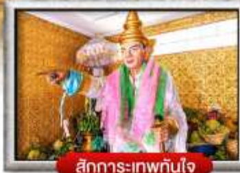
สักการะเทพทันใจ