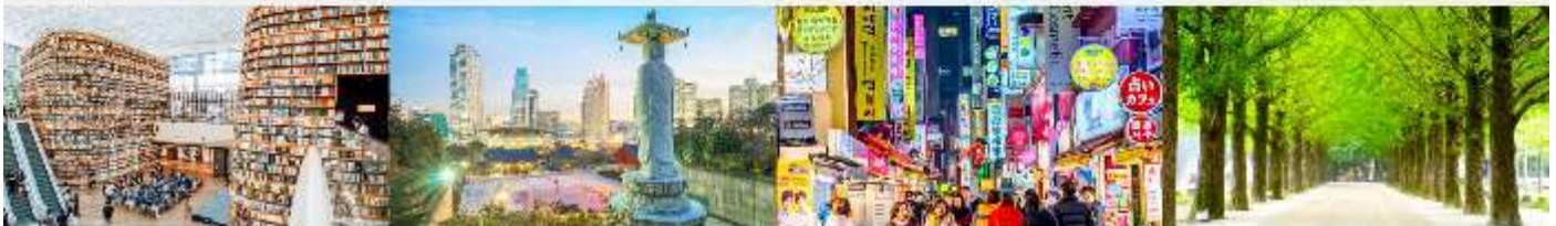
STARFIELD COEX MALL