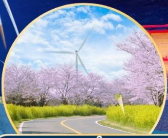
ซากระ / ทุ่งดอกเรป