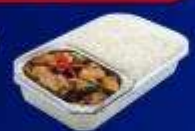
ข้าวกะเพราไก่