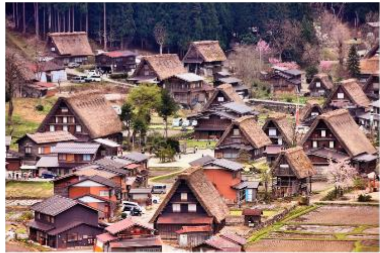
รูปใช้เพื่อประกอบการโฆษณาเท่านั้น