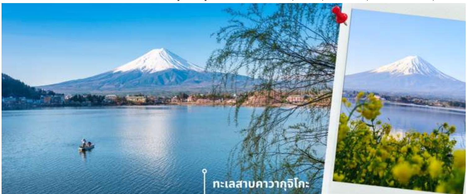
ทะเลสาบคาวากูจิโกะ

หลังรับประทานอาหารเช้า นำท่านแวะชม พิพิธภัณฑสถานแผ่นดินไหว เป็นพิพิธภัณฑสถานที่แสดงถึงผลกระทบจากภัยพิบัติแผ่นดินไหวและการระเบิดของภูเขาไฟ ภายในพิพิธภัณฑสถานมีห้องจัดแสดงข้อมูลการประทุของภูเขาไฟจากทุกมุมโลก โซนความรู้ต่างๆและโซนข้อปั้งสินค้าญี่ปุ่นอาทิเช่น ผลิตภัณฑ์เครื่องสำอางและของฝากอีกมากมาย พอสมควรแก่เวลานำท่านเดินทางสู่ ทะเลสาบคาวากูจิโกะ (Lake Kawaguchiko) ในจังหวัดยามานาชิ แหล่งท่องเที่ยวที่อยู่ไม่ไกลจากโตเกียว (Tokyo) หนึ่งในที่ที่เยวญี่ปุ่นยอดฮิตตลอดกาล ทะเลสาบที่กว้างใหญ่เป็นอันดับ 2 ของ 5 ทะเลสาบรอบภูเขาไฟฟูจิ อยู่บริเวณเชิงภูเขาไฟ ความสูงกว่าระดับน้ำทะเลประมาณ 800 เมตร ทำให้สภาพอากาศบริเวณนี้เย็นสบายตลอดปี รายล้อมไปด้วยธรรมชาติที่อุดมสมบูรณ์ และทิวทัศน์สวยงามตลอดปี ในช่วงเวลาที่พลาดไม่ได้เลยที่จะได้ชื่นชมดอกซากุระบาน คือในช่วงปลายเดือนมีนาคมจนถึงต้นเดือนเมษายน จะบานสะพรั่งสวยงามเรียงรายริมทะเลสาบสามารถชมวิวดูทั้งทะเลสาบและภูเขาไฟฟูจิได้อย่างชัดเจน นับเป็นจุดชมซากุระยอดฮิตที่สุดอีกแห่งหนึ่งในญี่ปุ่น