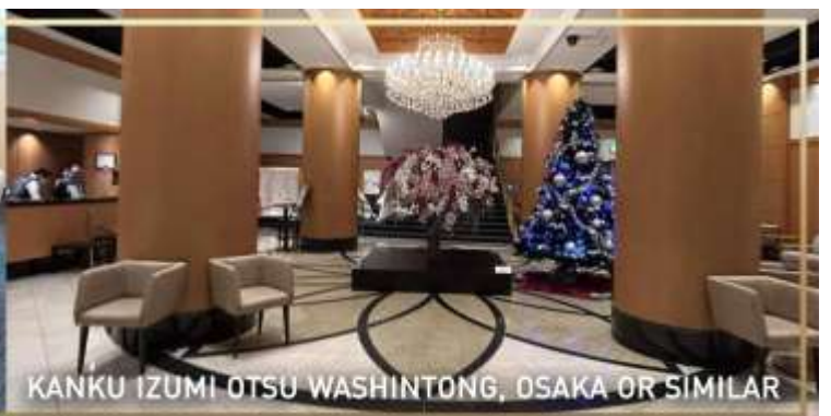
KANKU IZUMI OTSU WASHINTONG, OSAKA OR SIMILAR