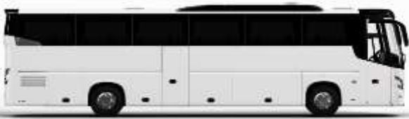
ตัวอย่างรถทัวร์ 1 คัน

ค่าที่พักตามที่ระบุในรายการหรือเทียบเท่าระดับเดียวกัน (พักห้องละ 2 ท่าน) หากประเภทห้องที่ท่านริเวสมาเป็นเช่นจาก เช่น ริเวสห้องพักเป็น TWIN BED หรือ DOUBLE BED ทางบริษัทขอสงวนสิทธิ์ในการปรับประเภทห้องพัก เป็นตามที่โรงแรมมีอยู่ โดยไม่ต้องแจ้งให้ทราบล่วงหน้า