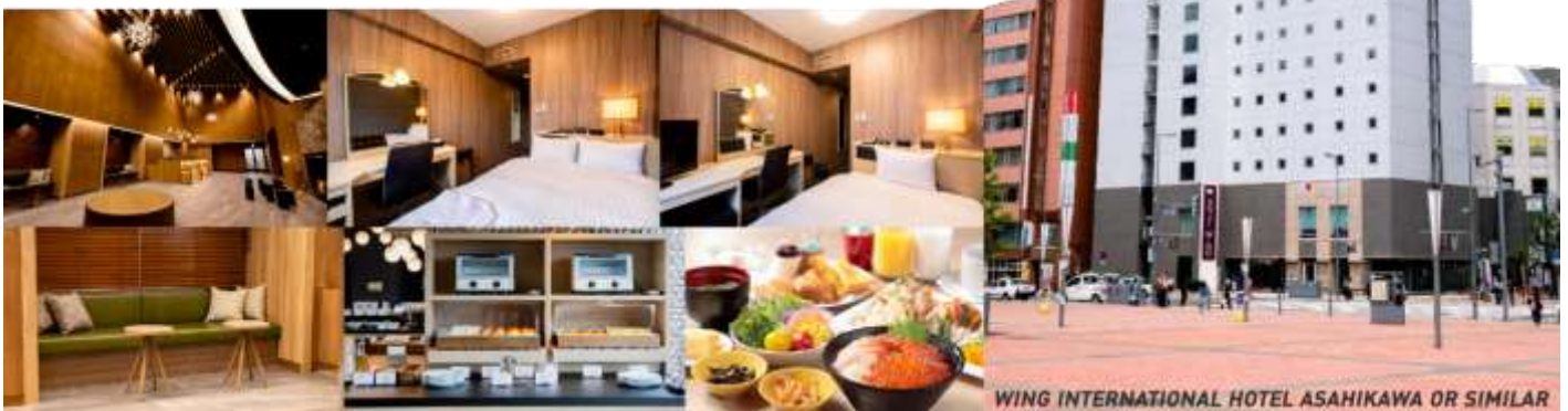
WING INTERNATIONAL HOTEL ASAHIKAWA OR SIMILAR

ที่พัก WING INTERNATIONAL HOTEL หรือ ART ASAHIKAWA, หรือเทียบเท่า