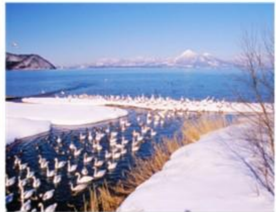
ทะเลสาบอินาวะชิโร Inawashiro-ko