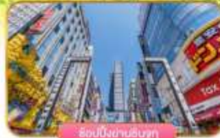
ช้อปปิ้งย่านชินจูกุ