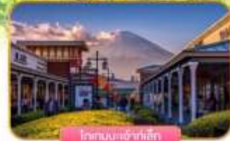
โรงแรมเจ้าฟ้าลิเก