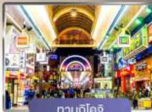
ทานุกิโคจิ