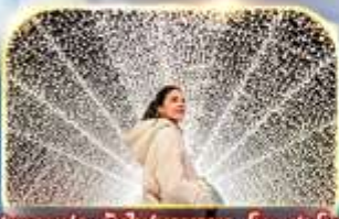
ชมงานประดับไฟนาฮานา โมะ ซาโตะ