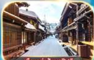
เมืองท่าชินมาชิซูจิ