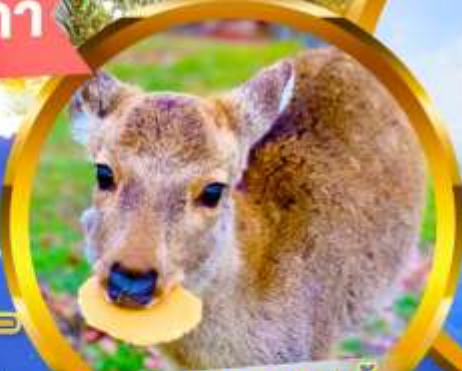
พิเศษสุด!! ชมเขมเป็ สำหรับป้อนน้องกวางทำนละ 1 ชุด

นั่งกระเช้าลอยฟ้าบิวาโกะ ตี๋มค้ำกับวิวสวย 360° กิจกรรมให้ชมเขมเป็กกับกวาง ณ เมืองนารา ช้อปปิ้งเอาท์เล็ตมอลล์ที่ใหญ่ที่สุดในนาโกย่า สัมผัสหมู่บ้านมรดกโลก ชิราคาวาโกะ