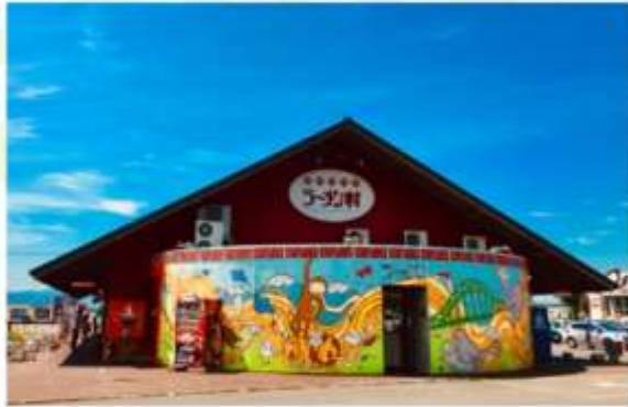
RAMEN VILLAGE ASAHIKAWA