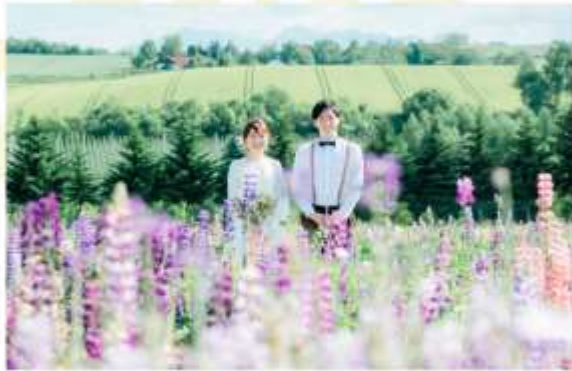
FLOWER LAND KAMIFURANO