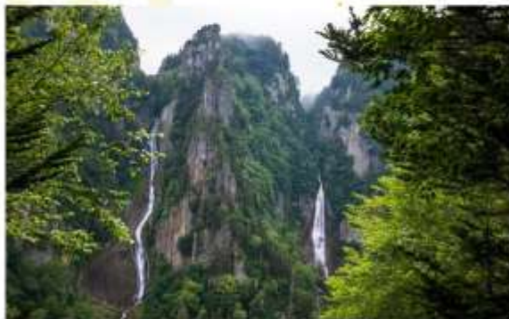
RYUSEI & GINGA WATERFALLS