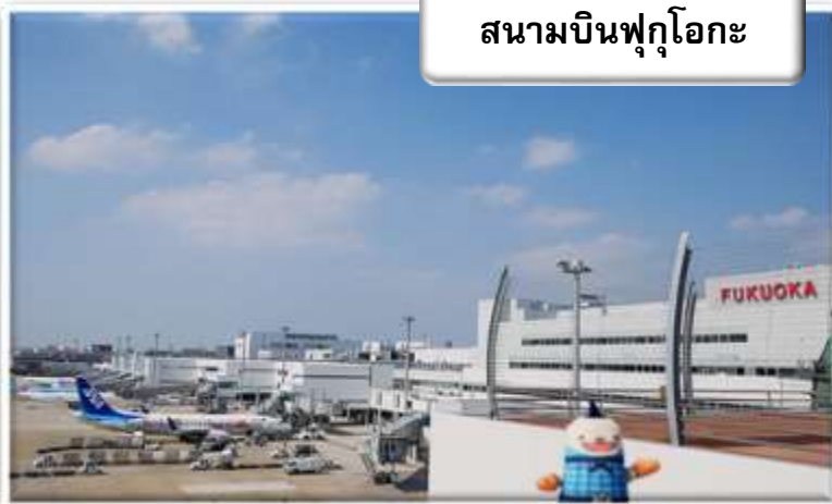
สนามบินฟุกุโอกะ

00.55 น. ออกเดินทางสู่ สนามบินฟุกุโอกะ ประเทศญี่ปุ่น โดยสายการบินไทย เที่ยวบินที่ TG 648