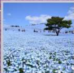
"HITACHI SEASIDE PARK"