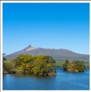
อุทยานแห่งชาติโอโนมะ