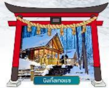
นิงเกิลเกอเรซ