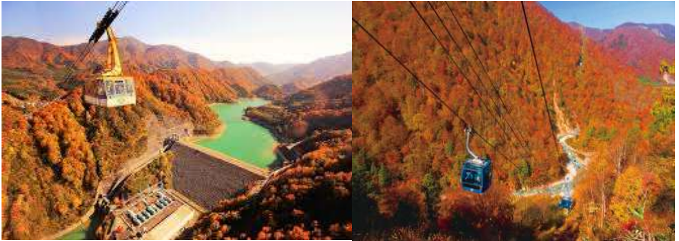
ของบริเวณโดยรอบ

Yuzawa Kogen Ropeway เป็นกระเช้าลอยฟ้าขนาดใหญ่ระดับโลกที่รองรับได้ถึง 166 คน ใช้เวลาเดินทางเพียง 7 นาทีบนเส้นทางราว 1,300 เมตรเชื่อมต่อระหว่างตีนเขากับ Panorama Park ที่อยู่เหนือระดับน้ำทะเลกว่า 1,000 เมตร หน้าสถานีพานอรามาบนยอดเขานั้นเป็นบริเวณที่มีบ่อแช่เท้าและระเบียงกลางแจ้ง ทั้งยังเชื่อมต่ออยู่กับ Kumo no Ue Cafe คาเฟ่ที่สามารถผ่อนคลายไปอย่างสบายๆกลางชมวิวสุดอลังการของที่ราบ Uonuma และเทือกเขา Tanigawa ที่แผ่กว้างอยู่เบื้องหน้า Panorama Park เป็นบริเวณที่มีการแบ่งออกเป็นหลายโซน สามารถเพลิดเพลินไปกับกิจกรรมที่หลากหลาย เช่น การโหนซิปไลน์หรือการเดินป่ากลางชมทิวทัศน์สุดอลังการ