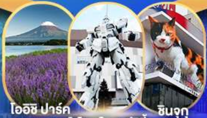
ไอชิ ปาร์ค ไอโดบะโตเวอริซึตี้ ชินจุกุ

อิสระท่องเที่ยวตามอัธยาศัย หรือเลือกซื้อทัวร์เสริมโตเกียวดิสนีย์แลนด์ แวะจุดชมวิวกิโอะชิปาร์ค ฟุจิซึบะ ซากุระ ชมทุ่งดอกฟิ่งคัมอส พิพิธภัณฑ์แผ่นดินไหว DUTY FREE ไอโดบะโตเวอริซึตี้ ซุปป์ิงชินจุกุ