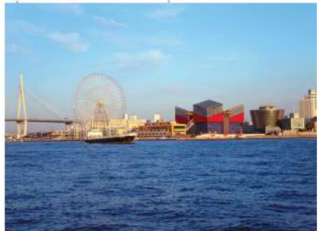
VISIT TEMPOZAN MARKET PLACE