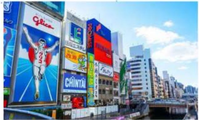
SHOPPING AT SHINSAIBASHI

“โรงงานชิกิกะโช” ชมมินิรูสมน ของฝากสุดคลาสสิกจากโอซาก้า มีขนมหวานมากกว่า 100 ชนิด รวมถึงขนมและเค้กญี่ปุ่น ท่านสามารถเพลิดเพลินกับการช้อปปิ้งขนมหวานได้ตามใจชอบ