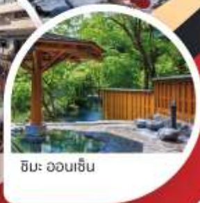
ชิมะ ออนเซ็น