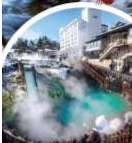
คุซัทสึออนเซ็น