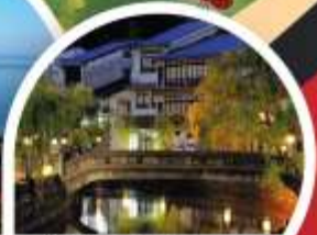
คิโนซากิ ออนเซ็น