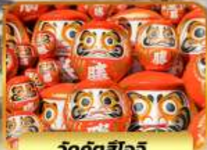
วัดคังสึโอจิ