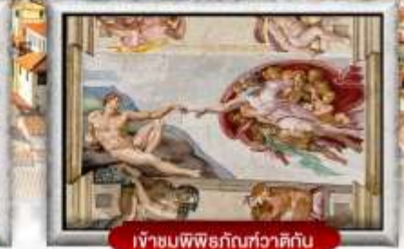
เข้าชมพิพิธภัณฑ์ทิวาติกัน

เมนูพิเศษ! สปาเกตตีเส้นหมึกดำ, พิซซ่าสไตล์อิตาลีเย็นแท้