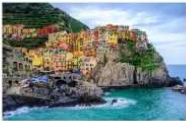
ซังควเอ เทเร

จากนั้นนำท่านเดินทางต่อด้วยรถไฟ สู่หมู่บ้านมรดกโลกและอุทยานแห่งชาติ ซังควเอ เทเร Cinque Terre อ่านว่า ซังควเอเทเร หรือแปลในความหมายตามภาษาอังกฤษก็คือ The Five Land แดนมหัศจรรย์ทั้ง 5 ที่ประกอบกันขึ้นมาเป็นดินแดนแห่งความงดงาม หมู่บ้านเล็กๆ 5 หมู่บ้านที่ซ่อนตัวอยู่ห่างไกลจากสายตาของคนภายนอก แผ่นดินที่ยากจะเข้าถึงได้โดยง่าย หมู่บ้านเล็กๆ 5 หมู่บ้านที่ตั้งเรียงอยู่มีห่างกัน