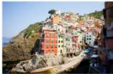
ซังควเอ เทเร