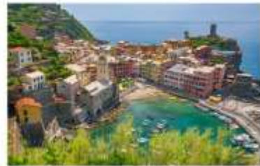
ซังควเอ เทเร

นำคณะเที่ยวชม ซังควเอ เทเร เป็นพื้นที่ที่ UNESCO ประกาศให้เป็นมรดกโลก ด้วยทำเลที่ตั้งของทั้งหมดอยู่บนภูเขาสูง โดมมีหน้าผาสูงชัน และทะเลกว้างใหญ่เป็นฉากหน้า ทำให้มีความสวยงามประดุจดั่งภาพวาด จึงเป็นอุปสรรคสำหรับผู้คนจากภายนอกในการที่จะเข้าไปให้ถึง แต่ในแง่ดีก็คือ หมู่บ้านทั้งห้ายังคงสภาพดั้งเดิมของมันมาได้ตั้งแต่ศตวรรษที่ 11 ประกอบไปด้วย Monterosso al Mare (มอนเตรอสโซ อัล มาเร), Vernazza (เวร์นาซซา), Corniglia (คอร์นีเลีย) , Manarola (มานาโรลา) และ Riomaggiore (ริออมัจจอร์เร) **ทางบริษัทจะนำทุกท่านเที่ยวอย่างน้อย 1 จากใน 5 หมู่บ้าน**