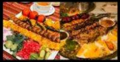
อาหารท้องถิ่นอิหร่านสุดพิเศษ