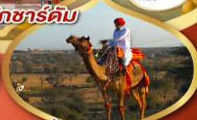
ฟรี ژیออู เมืองมันทอวา ราคาเริ่มต้น