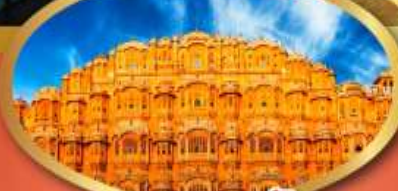
พระราชวัง สายลม