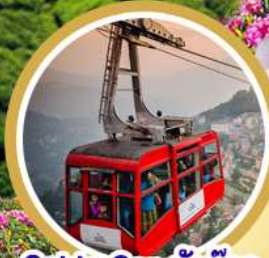
Cable Car กิ่งตอก