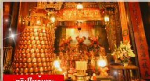
ทริบไหวพร: