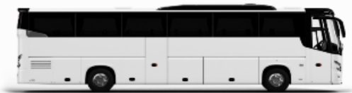
ตัวอย่างรถทัวร์ 1 ชั้น

หากประเภทห้องที่ท่านริเสกมาเต็มจาก เช่น ริเสกห้องพักเป็น TWIN BED หรือ DOUBLE BED ทางบริษัทขอสงวนสิทธิ์ในการปรับประเภทห้องพัก เป็นตามที่โรงแรมมีอยู่ โดยไม่ต้องแจ้งให้ทราบล่วงหน้า