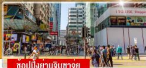
ชอปปีงย่านจิมซาจอย