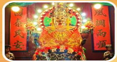
วัดเจ้าแม่กวนอิมเทียนทิว