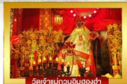
วัดเจ้าแม่กวนอิมฮองฮ่า