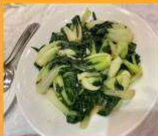
ผัดผักตามฤดูกาล