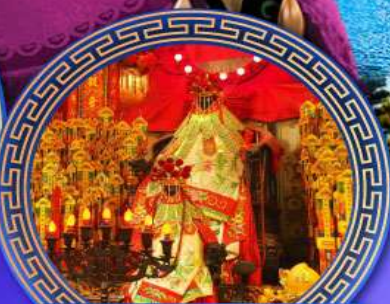
เจ้าแม่กวนอิมฮ่องกง