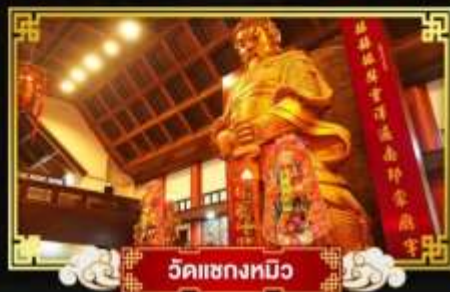
วัดแซงทิว