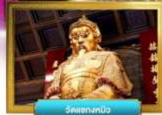
วัดเข่งทิว