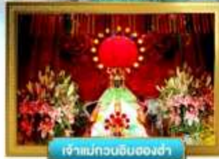
เจ้าแม่กวนอิมฮ่องซ่า