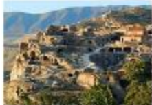
เมืองอุพลิสซิเค