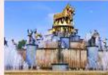
เมืองคูทไซ

** พักที่ Kutaisi Inn Hotel หรือเทียบเท่า **