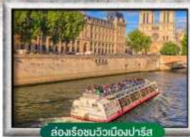
ล่องเรือชมวิวเมืองปารีส