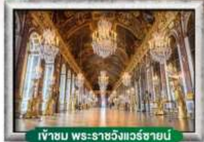
เข้าชม พระราชวังแวร์ซายน์